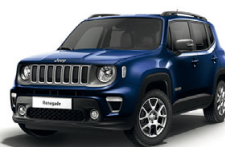
888 Niebieski Jetset (metalizowany)