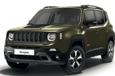
149 Zielony Matt Green (matowy) - tylko wersja Trailhawk