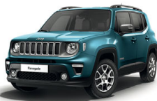
470 Bikini (metalizowany)