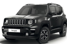
095 Grafitowy Granite Crystal (metalizowany)