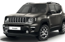
503 Sting Grey (pastelowy)