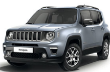
348 Srebrny Glacier (metalizowany)