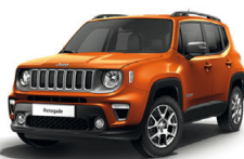
562 Pomarańczowy Omaha (pastelowy)