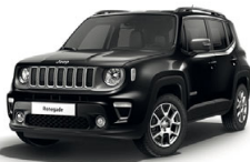
601 Czarny Solid (pastelowy)