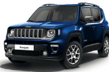
435 Blue Shade (pastelowy)