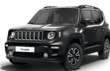
095 Grafitowy Granite Crystal (metalizowany)