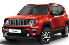
176 Czerwony Colorado (pastelowy)