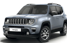
348 Srebrny Glacier (metalizowany)