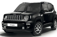
876 Czarny Carbon (metalizowany)