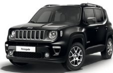
601 Czarny Solid (pastelowy)