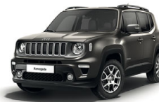
503 Sting Grey (pastelowy)