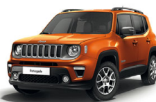
562 Pomarańczowy Omaha (pastelowy)