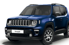
888 Niebieski Jetset (metalizowany)