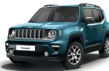
470 Bikini (metalizowany)