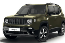
149 Zielony Matt Green (matowy) - tylko wersja Trailhawk