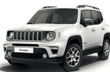
296 Biały Alpine (pastelowy)