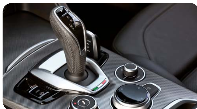
Nowa konsola środkowa oferuje większą funkcjonalność i ekskluzywne wykończenie

Cennik zawiera ceny detaliczne w złotych z VAT. Ceny zawierają podatek akcyzowy. Ceny mogą ulec zmianom bez uprzedniego zawiadomienia w przypadku zmian cen przez producenta, zmian podatkowych, przepisów celnych lub innych przyczyn. Wyposażenie seryjne i dodatkowe poszczególnych modeli może ulegać zmianom w zależności od potrzeb poszczególnych rynków i wymogów prawnych. Dane w niniejszym cenniku mają charakter orientacyjny i nie stanowią oferty w rozumieniu Kodeksu Cywilnego.