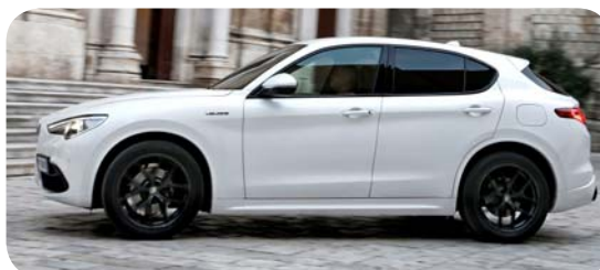
Wersja Veloce charakteryzuje się lakierowanymi detalami nadwozia, m.in. łukami nadkoli i dolną częścią zderzaka

Cennik zawiera ceny detaliczne w złotych z VAT. Ceny zawierają podatek akcyzowy. Ceny mogą ulec zmianom bez uprzedniego zawiadomienia w przypadku zmian cen przez producenta, zmian podatkowych, przepisów celnych lub innych przyczyn. Wyposażenie seryjne i dodatkowe poszczególnych modeli może ulegać zmianom w zależności od potrzeb poszczególnych rynków i wymogów prawnych. Dane w niniejszym cenniku mają charakter orientacyjny i nie stanowią oferty w rozumieniu Kodeksu Cywilnego.