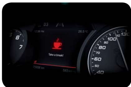
Asystent uwagi kierowcy