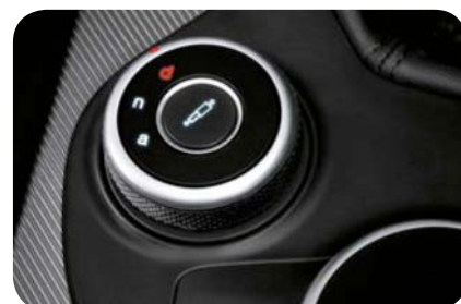
Zawieszenie aktywne Alfa Active Suspension

Cennik zawiera ceny detaliczne w złotych z VAT. Ceny zawierają podatek akcyzowy. Ceny mogą ulec zmianom bez uprzedniego zawiadomienia w przypadku zmian cen przez producenta, zmian podatkowych, przepisów celnych lub innych przyczyn. Wyposażenie seryjne i dodatkowe poszczególnych modeli może ulegać zmianom w zależności od potrzeb poszczególnych rynków i wymogów prawnych. Dane w niniejszym cenniku mają charakter orientacyjny i nie stanowią oferty w rozumieniu Kodeksu Cywilnego.