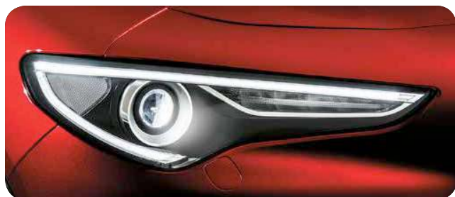
Pakiet Lighting (światła bi-ksenonowe ze spryskiwaczami)

■ opcja standardowa; - opcja niedostępna