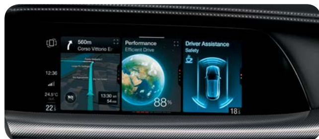
Udoskonalony system multimedialny z interaktywnymi widżetami i wyświetlaczem dotykowym 8,8" w standardzie