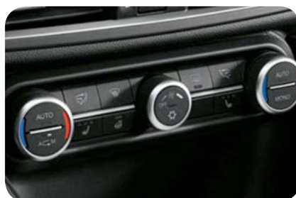
Pakiet zimowy: podgrzewane fotele przednie + podgrzewana kierownica