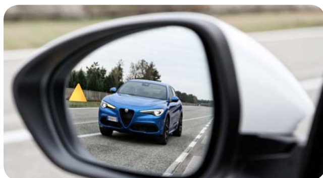
Zaawansowane systemy asystujące kierowcy stawiają Stelvio w czołówce najbezpieczniejszych aut segmentu