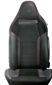
Czarne Sparco (opcja)