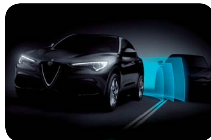
Aktywne monitorowanie martwego pola