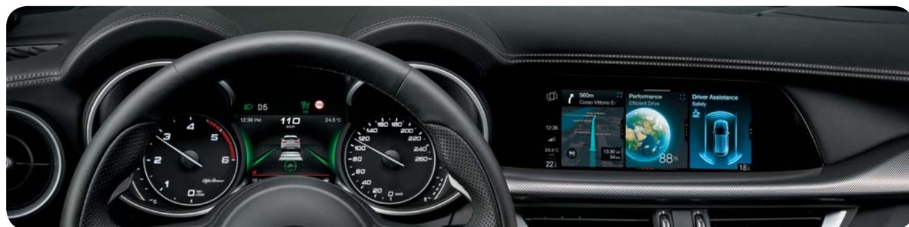
7" wyświetlacz w zestawie wskaźników daje dostęp do najważniejszych informacji bez odrywania wzroku od drogi

■ opcja standardowa; - opcja niedostępna