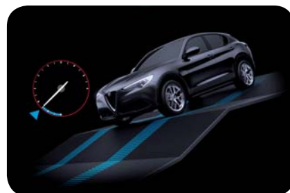
System kontroli zjazdu

Cennik zawiera ceny detaliczne w złotych z VAT. Ceny zawierają podatek akcyzowy. Ceny mogą ulec zmianom bez uprzedniego zawiadomienia w przypadku zmian cen przez producenta, zmian podatkowych, przepisów celnych lub innych przyczyn. Wyposażenie seryjne i dodatkowe poszczególnych modeli może ulegać zmianom w zależności od potrzeb poszczególnych rynków i wymogów prawnych. Dane w niniejszym cenniku mają charakter orientacyjny i nie stanowią oferty w rozumieniu Kodeksu Cywilnego.