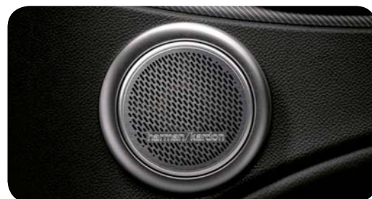
System HI FI by Harman Kardon

Cennik zawiera ceny detaliczne w złotych z VAT. Ceny zawierają podatek akcyzowy. Ceny mogą ulec zmianom bez uprzedniego zawiadomienia w przypadku zmian cen przez producenta, zmian podatkowych, przepisów celnych lub innych przyczyn. Wyposażenie seryjne i dodatkowe poszczególnych modeli może ulegać zmianom w zależności od potrzeb poszczególnych rynków i wymogów prawnych. Dane w niniejszym cenniku mają charakter orientacyjny i nie stanowią oferty w rozumieniu Kodeksu Cywilnego.