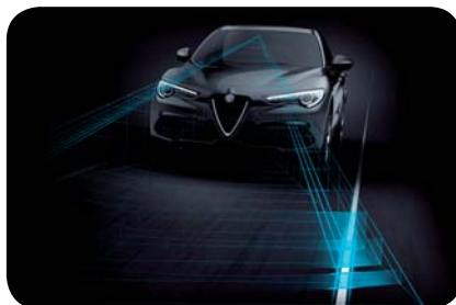
Asystent pasa ruchu