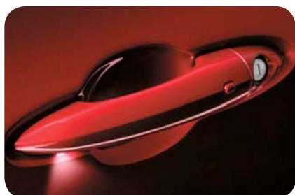
Bezkluczykowe otwarcie drzwi - keyless Entry