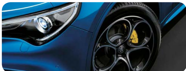
Zaciski hamulców lakierowane na: czarno, czerwono lub żółto

■ opcja standardowa; P - dostępne w pakiecie; - opcja niedostępna *dostępne w trzecim kwartale 2020