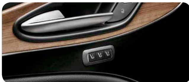
Pakiet Luxury, wykończenie wnętrza w drewnie brązowy orzech

Cennik zawiera ceny detaliczne w złotych z VAT. Ceny zawierają podatek akcyzowy. Ceny mogą ulec zmianom bez uprzedniego zawiadomienia w przypadku zmian cen przez producenta, zmian podatkowych, przepisów celnych lub innych przyczyn. Wyposażenie seryjne i dodatkowe poszczególnych modeli może ulegać zmianom w zależności od potrzeb poszczególnych rynków i wymogów prawnych. Dane w niniejszym cenniku mają charakter orientacyjny i nie stanowią oferty w rozumieniu Kodeksu Cywilnego.