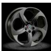
1MT / 1MQ / 1MS