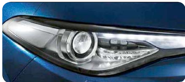
Pakiet Lighting (światła bi-ksenonowe 35 Watt ze spryskiwaczami reflektorów)