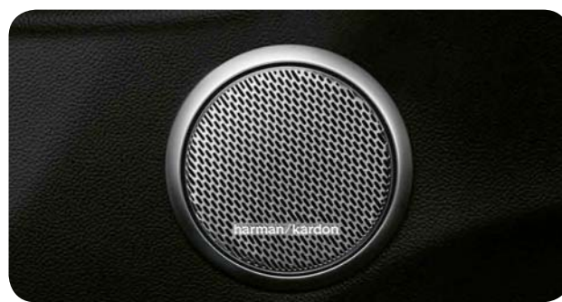
System HI FI by Harman Kardon

Cennik zawiera ceny detaliczne brutto w złotych zawierające podatek VAT. Ceny zawierają podatek akcyzowy. Ceny mogą ulec zmianom bez uprzedniego zawiadomienia w przypadku zmian cen przez producenta, zmian podatkowych, przepisów celnych lub innych przyczyn. Wyposażenie seryjne i dodatkowe poszczególnych modeli może ulegać zmianom w zależności od potrzeb poszczególnych rynków i wymogów prawnych. Dane w niniejszym cenniku mają charakter orientacyjny i nie stanowią oferty w rozumieniu Kodeksu Cywilnego.