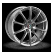
1M7 / 1M8 / 1M9