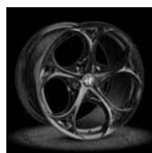
3CV / 3DB