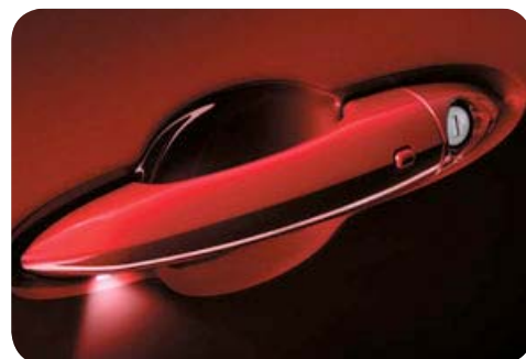
Bezkluczkowe otwarcie drzwi - Keyless Entry

Cennik zawiera ceny detaliczne brutto w złotych zawierające podatek VAT. Ceny zawierają podatek akcyzowy. Ceny mogą ulec zmianom bez uprzedniego zawiadomienia w przypadku zmian cen przez producenta, zmian podatkowych, przepisów celnych lub innych przyczyn. Wypożyczenie seryjne i dodatkowe poszczególnych modeli może ulegać zmianom w zależności od potrzeb poszczególnych rynków i wymogów prawnych. Dane w niniejszym cenniku mają charakter orientacyjny i nie stanowią oferty w rozumieniu Kodeksu Cywilnego.