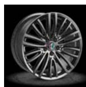
1MP / 1ML / 1MN