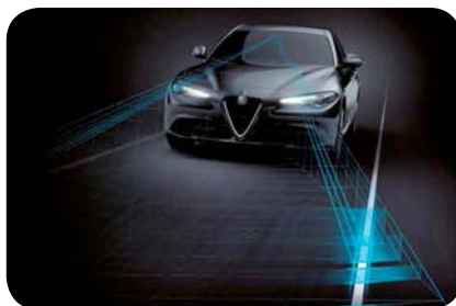
Asystent pasa ruchu