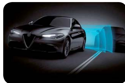
Aktywne monitorowanie martwego pola