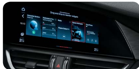
Nowy system multimedialny z wyświetlaczem dotykowym 8,8" w standardzie

Cennik zawiera ceny detaliczne brutto w złotych zawierające podatek VAT. Ceny zawierają podatek akcyzowy. Ceny mogą ulec zmianom bez uprzedniego zawiadomienia w przypadku zmian cen przez producenta, zmian podatkowych, przepisów celnych lub innych przyczyn. Wypożyczenie seryjne i dodatkowe poszczególnych modeli może ulegać zmianom w zależności od potrzeb poszczególnych rynków i wymogów prawnych. Dane w niniejszym cenniku mają charakter orientacyjny i nie stanowią oferty w rozumieniu Kodeksu Cywilnego.