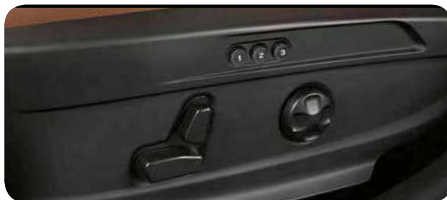
Pakiet Elektryczne fotele z pamięcią ustawień

Cennik zawiera ceny detaliczne brutto w złotych zawierające podatek VAT. Ceny zawierają podatek akcyzowy. Ceny mogą ulec zmianom bez uprzedniego zawiadomienia w przypadku zmian cen przez producenta, zmian podatkowych, przepisów celnych lub innych przyczyn. Wypożyczenie seryjne i dodatkowe poszczególnych modeli może ulegać zmianom w zależności od potrzeb poszczególnych rynków i wymogów prawnych. Dane w niniejszym cenniku mają charakter orientacyjny i nie stanowią oferty w rozumieniu Kodeksu Cywilnego.