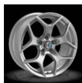
3CK / 3CH / 3CJ