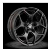
3CG / 3AL / 3AV

Cennik zawiera ceny detaliczne brutto w złotych zawierające podatek VAT. Ceny zawierają podatek akcyzowy. Ceny mogą ulec zmianom bez uprzedniego zawiadomienia w przypadku zmian cen przez producenta, zmian podatkowych, przepisów celnych lub innych przyczyn. Wyposażenie seryjne i dodatkowe poszczególnych modeli może ulegać zmianom w zależności od potrzeb poszczególnych rynków i wymogów prawnych. Dane w niniejszym cenniku mają charakter orientacyjny i nie stanowią oferty w rozumieniu Kodeksu Obywatelnego.