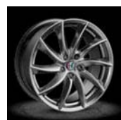
3CO / 3CL / 3CN