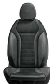
497 / 017 / 027 Czarne